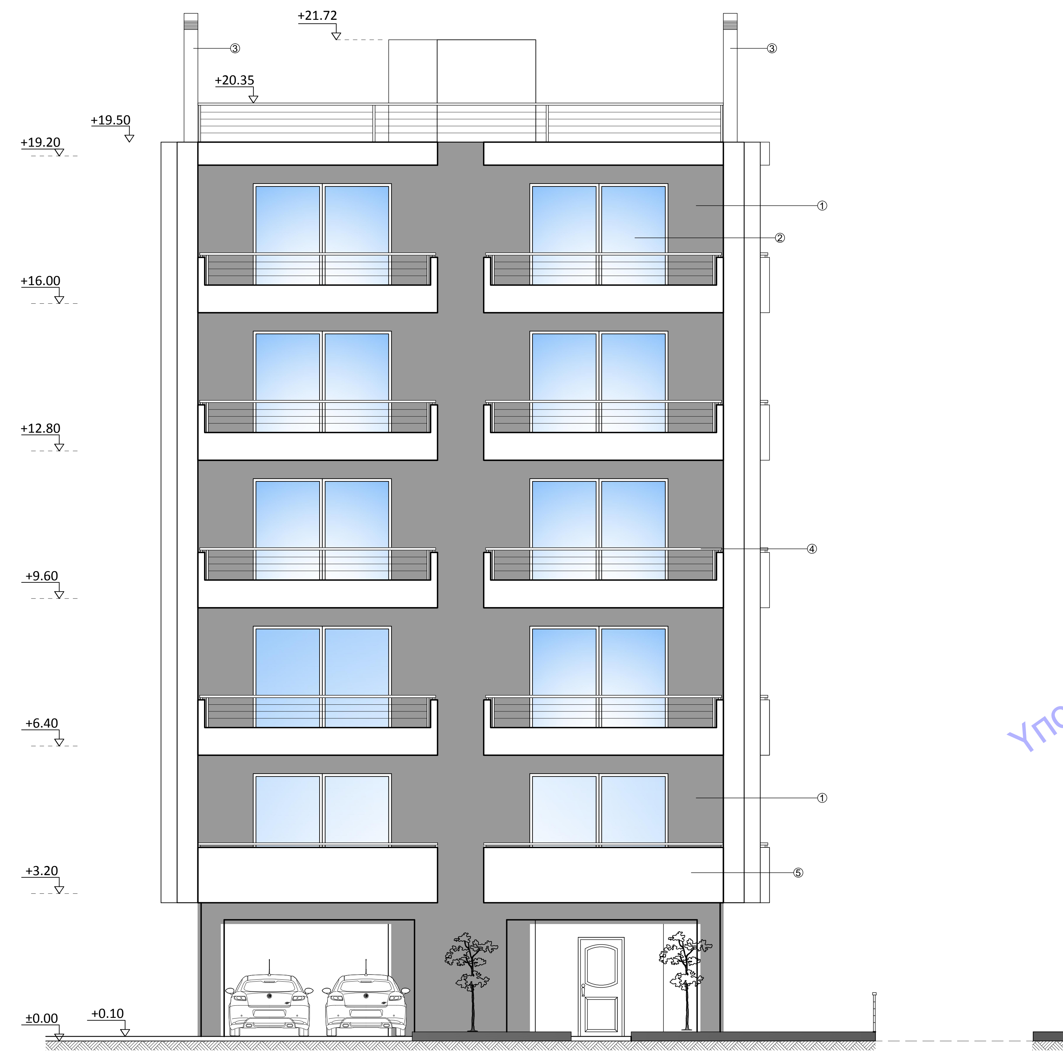
ΝΟΤΙΟΑΝΑΤΟΛΙΚΗ ΟΨΗ επί οδού Λυκούργου